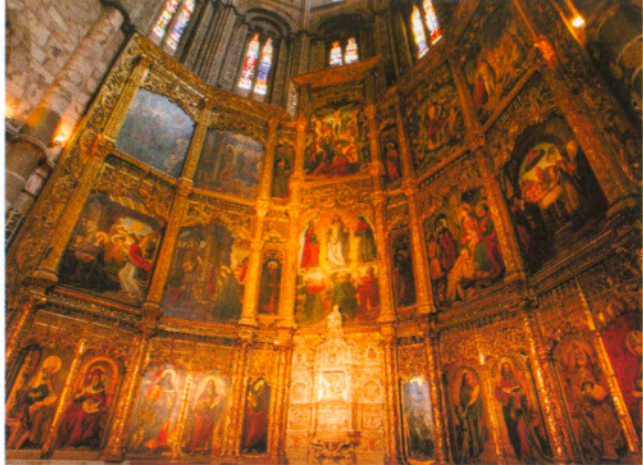
Retablo de la capilla mayor de la catedral / The cathedral's altar piece