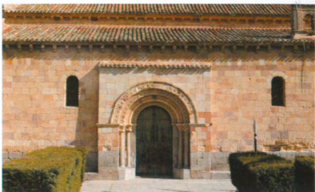
Fachada sur de San Andrés / Southern facade of the church of San Andrés