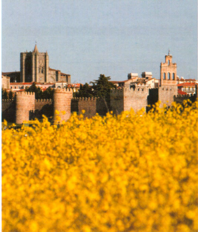
Lienzo norte de la muralla / Northern view of the wall