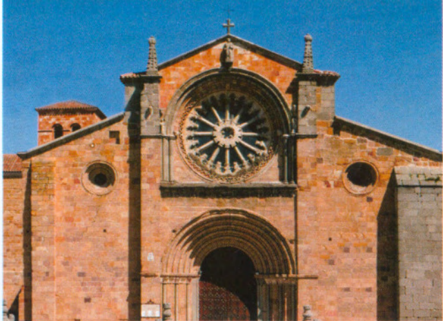
Fachada oeste de San Pedro / Western facade of San Pedro