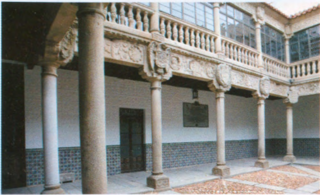
Plateresco en el Palacio de Polentinos / Plateresco of the Palacio de Polentinos