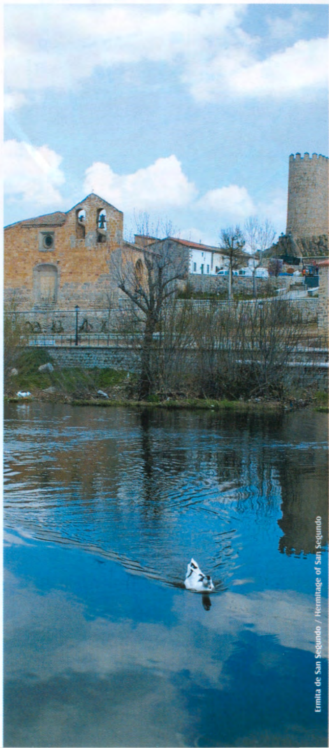
Ermite de San Segundo / Hermitage of San Segundo