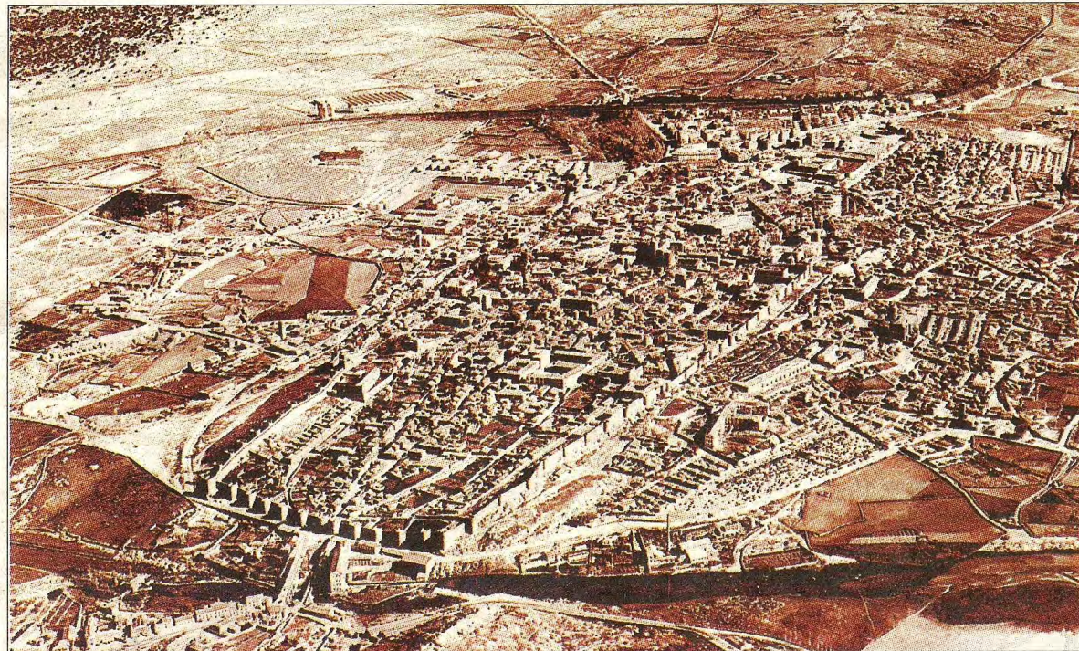
Imagen de una de las láminas que forma la colección

Las láminas se irán entregando gratuitamente con los ejemplares de este periódico desde este domingo, cuando también se entregará, y también de manera gratuita, la carpeta para guardar las mismas. Des-